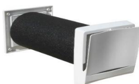
Uteluftdon med bra luftspridning (säljs av flera företag)

Frånluftssystemens akilleshäl är väggventilernas luftspridande egenskaper och dragrisker. Spaltventiler har för stora tryckfall med för små luftflöden och komfortproblem.